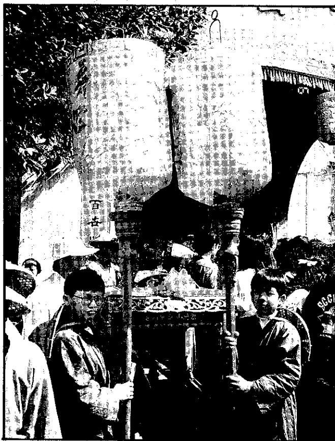
「兩姓合婚」「百子千孫」的紅大燈

古代婚禮過程中的繁文縟節， 雖已不合現代社會所需， 但是從環環相扣的禮儀中， 不單具有莊嚴神聖的場面， 更流露出令人感動的綿綿情意。