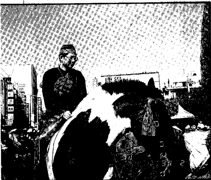
新郎春風滿面騎大馬，喜氣洋洋的迎娶新娘。