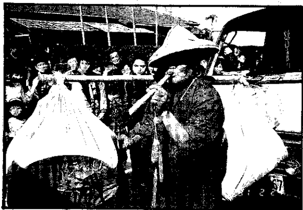
嫁妝尾後(脚桶、尿桶)