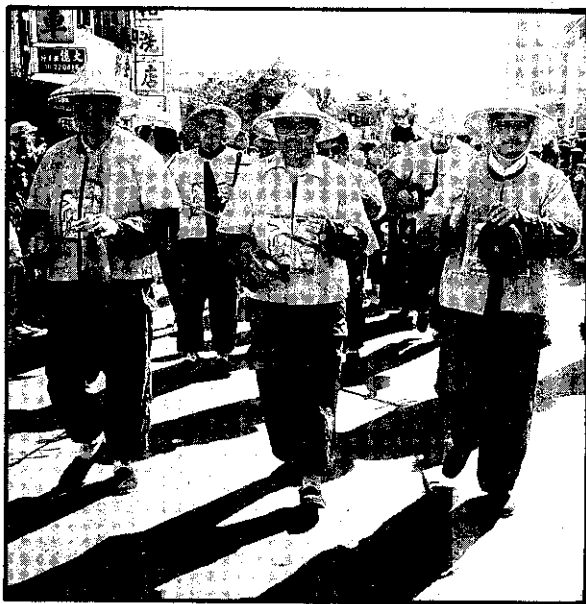
紅甲吹(小樂隊)引導