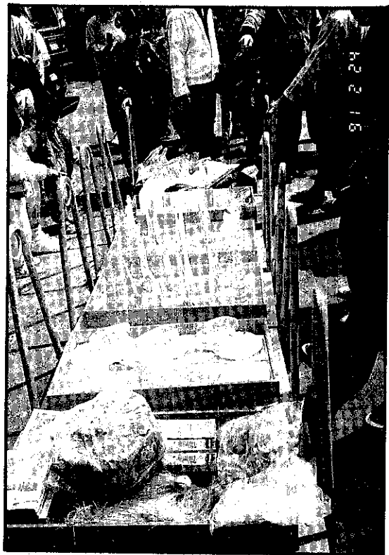
紅檯裝炮竹、喜餅、代表甜甜蜜蜜永遠相隨的糖菓及鴛鴦肉、魚等牲禮。