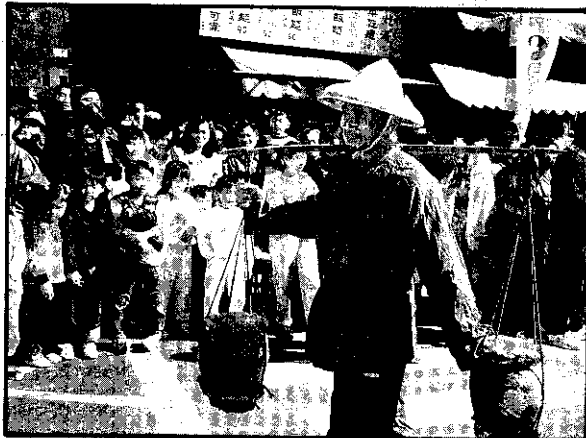
嫁妝「女兒紅」這擔酒早在女兒出生時就釀造