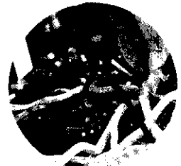
蘭花使用滴灌設備有調節花期及增產效果。