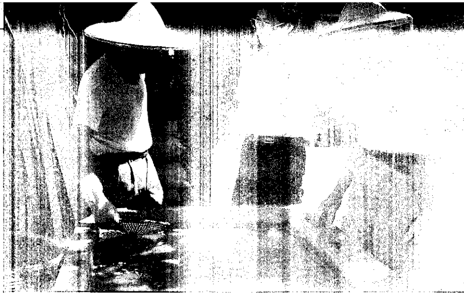
把“老人”看成是一群具有同樣問題的群體，並不十分妥當。

。許多專家均認為，可以透過適當的醫療保健、營養、長時間維持老人生活品質標準，使老人直到死亡之前，仍能維持生活品質標準，而不必忍受病痛折磨。此外，慢性高血壓、糖尿病等的篩檢與治療，高於平常的防治與健康的維護非常有效，衛生單位應該積極辦理。