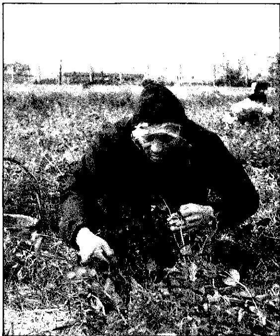
讓老人隨時保持健康，進而促進健康，活得更長壽、更好、更有尊嚴。

隨着年齡的增加，身體功能逐漸衰退，老年人較易罹患各種疾病。老年人的健康問題，實不容忽視。再加上社會、經濟各方面的急速變遷，老年人不但需要醫療方面的照護，更需