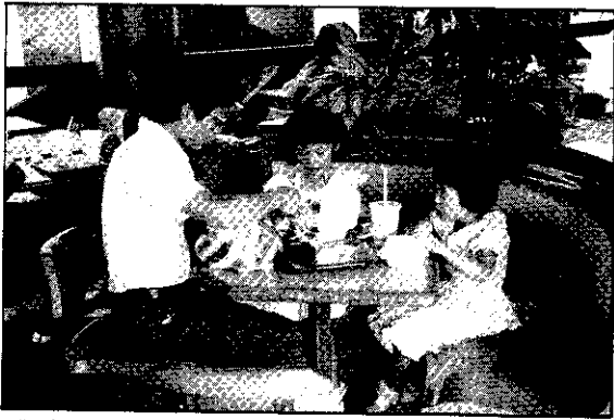
男孩、女孩一樣好，兩個孩子恰恰好！