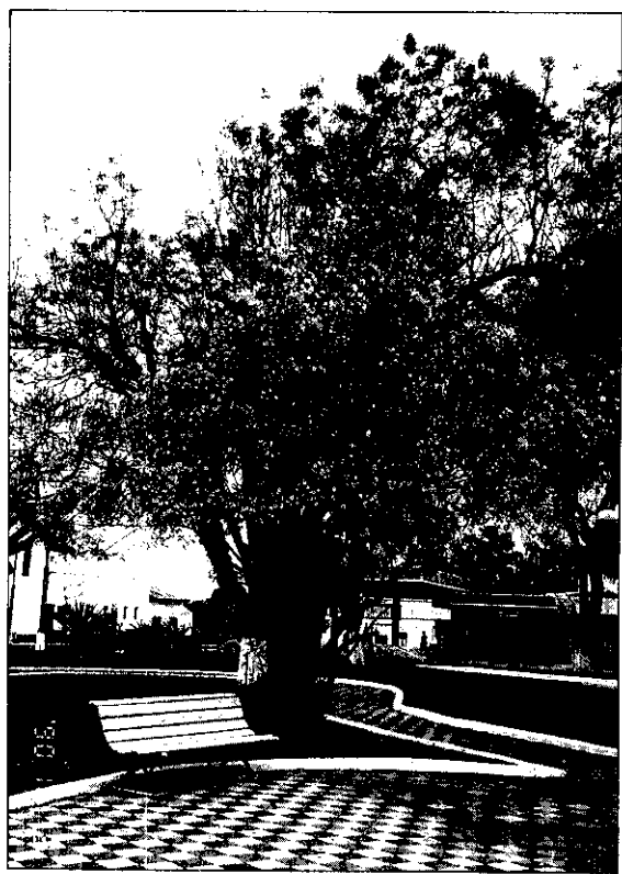
這是巴拉圭一座小型公園種的夾竹桃

樹薯屬於較粗放作物，容易栽種，於是在在鄉村之自家厝邊都可看到種木薯，種植後約1~2年即開始收成，如需要時可掘取樹薯煮熟充飢，即不愁沒有東西可吃！