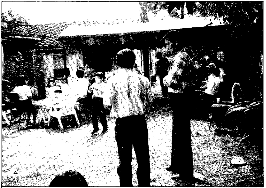
遇有聚餐，團員都會遠從3~4公里外的工作地點趕來聚敘。

→ 購買剝削、三是交貨剝削，其中以利息剝削最嚴重，銀行利息達36%，向民間財團貸款或領種子、農藥之利息達50%；該國農民清苦，無資金購買種子、肥料及農藥…等農業資材，導致產量低及生產意願低落。農技團為協助巴國農民生產，在示範村經調查合格者每戶貸放生產資金3萬瓜拉尼（約台幣6千元），利息年息9%，貸放4個月利息為6,800瓜拉尼，與銀行或民間高利貸相比低了很多。我曾在一示範村收回貸款時，數位農民表示非常感激，但他們希望能提高貸款額度，以利生產，如此才可避免財團或銀行高利貸剝削，提升生產意願，改善其生活。