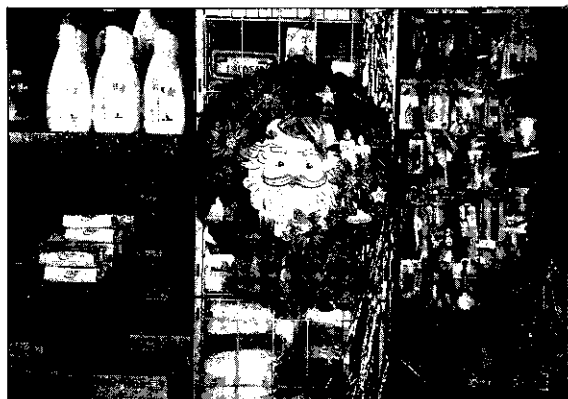
小店舖掛的耶誕節飾品