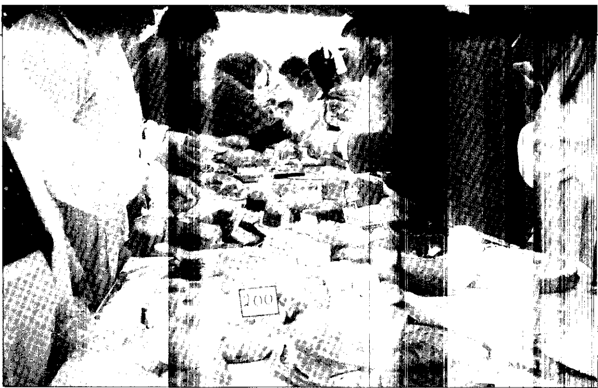
樹薯和麵包為巴國人的主食

→ 食用樹薯和肉食，加上不喜吃蔬菜及水果，身體營養平衡不佳，再者不喜運動，其肥胖者不少，男人「魷魚肚」凸顯；女人三圍36以上比比皆是，但奇怪的是，他們胖者多不生病，這可能與生活壓力輕、空氣好有關，再就是巴國人對胖，表示其「富有」，以至於對減肥不予重視！