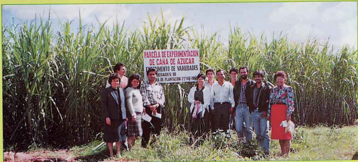
參加蔗作班的學員與指導老師合影