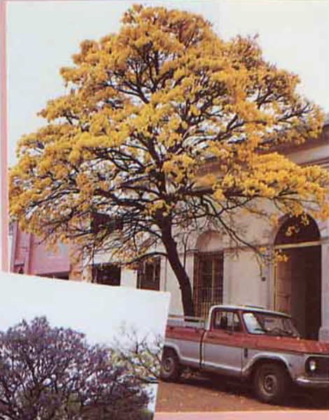
由左至右，皆為拉巴久花株，顏色不同，因而顯出不同的風姿。