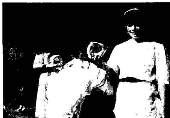
到處可買到的餅圈

如今已建妥示範村有7村，正在積極展開的雜作物有玉米、棉花、大豆及洋蔥、胡蘿蔔以及果樹之技術輔導及推廣工作，至於畜牧方面是養豬、養鴨、養雞……等技術輔導及推廣工作，由於成就斐然，巴國人對我方熱心協助，甚為歡迎與滿意。