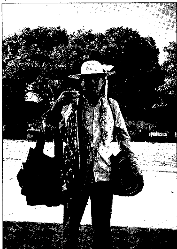
我不是觀光客，我是賣飾品的小販。