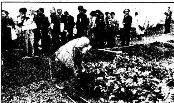
有興趣者紛紛參觀空氣室的作物栽培