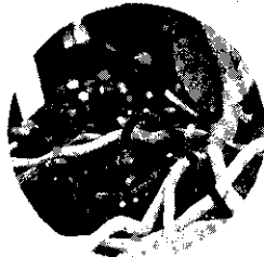
蘭花使用滴灌設備有調節花期及增影效果。