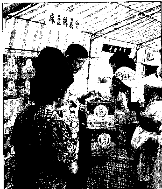
麻豆文旦柚在展售會中出盡風頭，銷售額占總銷售額1/3強。

對於這次文旦大集合的展售會，也有人說買不到“精品”，事實上，這是不公平甚至不正確的看法，因為這次主辦單位組有“產品展售評鑑會”其任務就是去蕪存菁，對產品的品質、售價都有評鑑，對服務態度也有注意。再