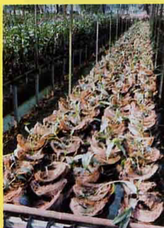
●椰子殼種蘭花經濟又實惠