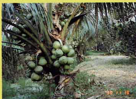
●間作水菜生長情景