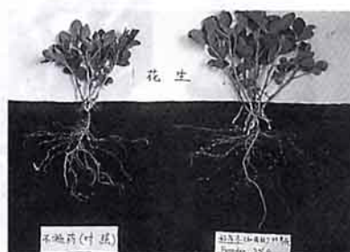
花生 (左) 未施藥 (右) 施好年冬