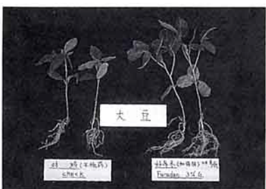
大豆 (左) 未施藥 (右) 施好年冬

農藥許可證農藥字第0882號 本農藥係美國FMC Corporation在 中華民國獲准發明專利之產品。 本公司並獲農用粒狀藥劑發明專利 15年經濟部中央標準局發明專利 證書第9685號 中央標準局商標註冊證第135144號 與第86457與第75837號 台省農藥廣告字第770101號