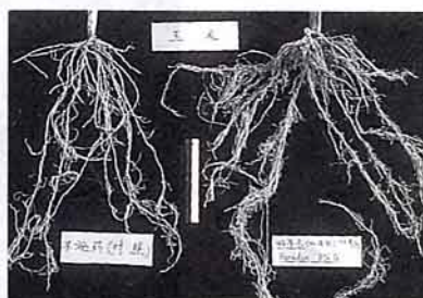
玉米 (左) 未施藥 (右) 施好年冬

農藥許可證農藥字第0882號 本農藥係美國FMC Corporation在 中華民國獲准發明專利之產品。 本公司並獲農用粒狀藥劑發明專利 15年經濟部中央標準局發明專利 證書第9685號 中央標準局商標註冊證第135144號 與第86457與第75837號 台省農藥廣告字第770101號