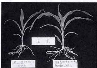
玉米 (左) 未施藥 (右) 施好年冬