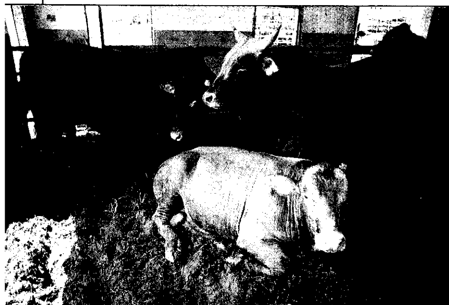
牛舍乾燥，牛隻軀體就少有污染。

畜試所新推出的“厩肥牛舍”，是繼“厩肥豬舍”推出的新點子。畜試所恆春分所所長成游貴博士說，明年開始將要大力推廣。