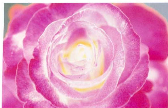
圖6. 要獲得良好品質的玫瑰必需有充分的知識、勤勞、耐心呵護，才有能有良好的成果。