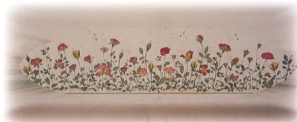
圖4. 玫瑰花除作切花外尚可作押花、乾燥花、花茶、花浴等，另有飲食、休閒、工藝品等多方面之用途。