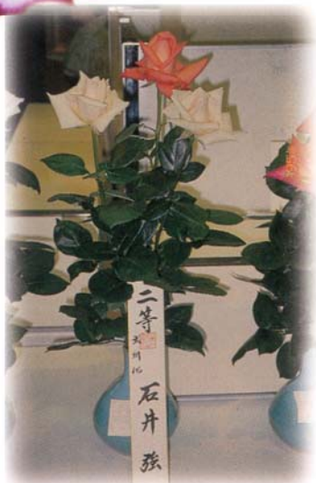
圖1. "品質"是確保競爭力之基本條件。