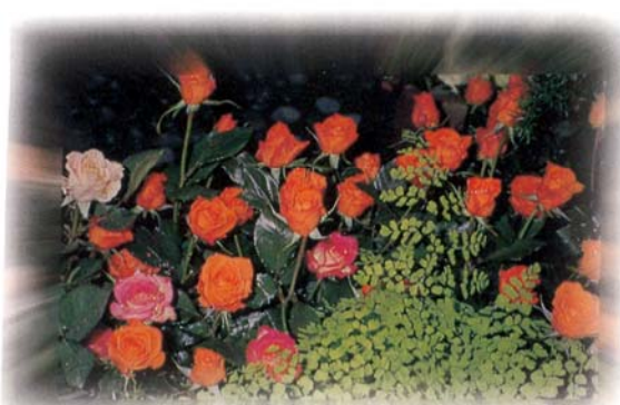
圖5. 為求花卉永續經營，應將有形的設施、設備，及無形的經驗、知識傳承下去。