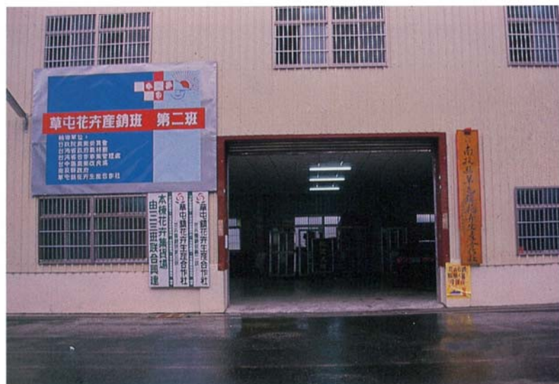
圖2. 組成花卉產銷班集合眾人之力，彼此交換心得，建立良好的產銷班商品信譽。