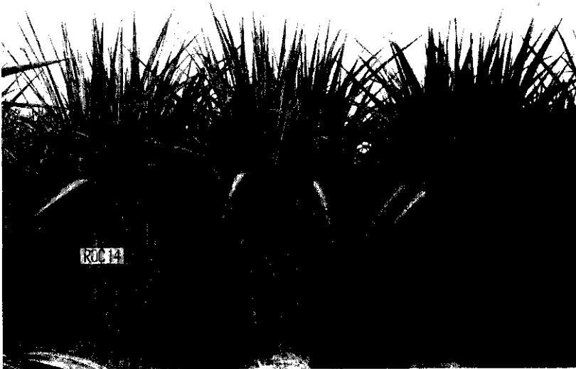
圖1. ROC14號品種甘蔗生育情形

△ □ 糖公司為增加不同質地土壤種植甘蔗品種，以提高單位面積產糖量起見，所屬糖業研究所於80年中，又推出了適合紅土地栽培之ROC14號與宜於石礫地種植之ROC15號兩個優良新品種介紹給農民，以便對這兩個甘蔗新品種有所認識與瞭解。