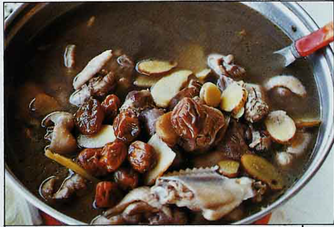
梅仔雞令人垂涎三尺

目前農民經營梅樹的困難是沒辦法在採梅的適當時機找到足夠工人採梅子，以致常造成損失。如果政府能加速改良梅子採果機或比照國軍助割方式幫忙採梅的話，情況也許可以改善，如果能規劃觀光採梅區那就更好了。因為