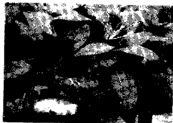
綠油油的蔬菜，享受獨自培育的成果