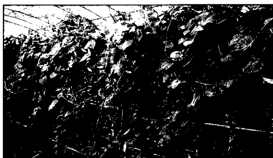
設施內豆柵式栽培