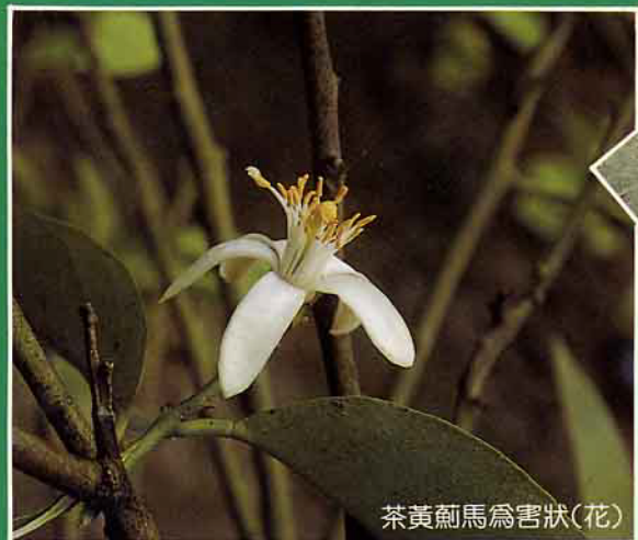
茶黃薊馬為害狀(花)