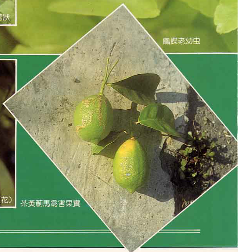
茶黃薊馬為害果實