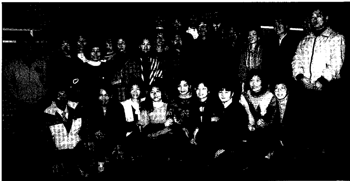
李總統會二度前來巡視，並與農會基層幹部合影。(站在李總統右邊者為溫總幹事)

宣導、農會業務推展及意見溝通等貢獻良多。同時辦理農忙托兒所，使農村幼兒接受學前的完整教育；對農保業務尤其力行，不管假日與否，服務會員，嘉惠農民。