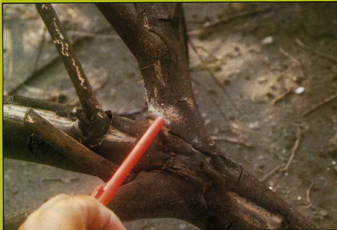
赤衣病菌絲孢子堆