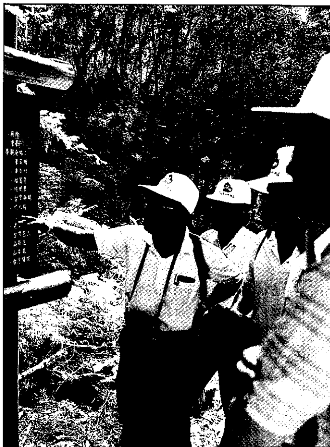
林業人員以平實而富有親和力的解說方式傳播林業知識

造林是厚植森林資源的基礎工作，台灣地區自民前12年起即實施人工造林，光復以後更積極推行，在45年~49年期間推行全省擴大造林計畫，每年平均達37,000餘公頃，對台灣森林在戰時遭受破壞之復舊，厥功甚偉。自56年~70年，復執行林相變更及林業經營改革方案擴大造林，年造林面積亦達3萬公頃，迨71年起，由於伐木量減少，造林預定的相對減少，而其餘之國公有林地多已完成造林，故71~79年間，僅造林82,000公頃；總計光復後至79年度止，累計造林延面積，扣除屆伐期伐採利用、造林後天然災害（颱風、霜雪、旱害及病虫害鼠害）人為侵害（盜伐、濫墾、火災延燒。）土地不適及林地解除變更用途等，現存面積為676,900公頃。此一寶貴的森林資源，不僅其造林樹種之選擇，係依據不同的土地環境予以審慎評估後決定，新植時注重成活率的檢驗，且