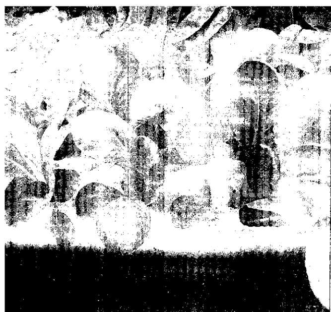
右側兩行蔬菜因加了綜合波羅酸煙草片特別綠，左側兩行未加則較黃。