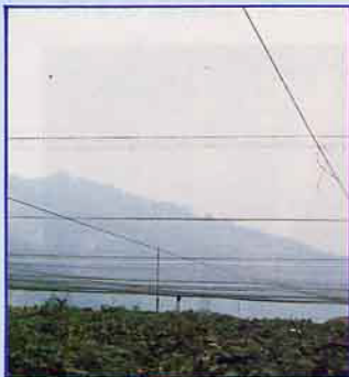
葡萄園使用防鳥網實景