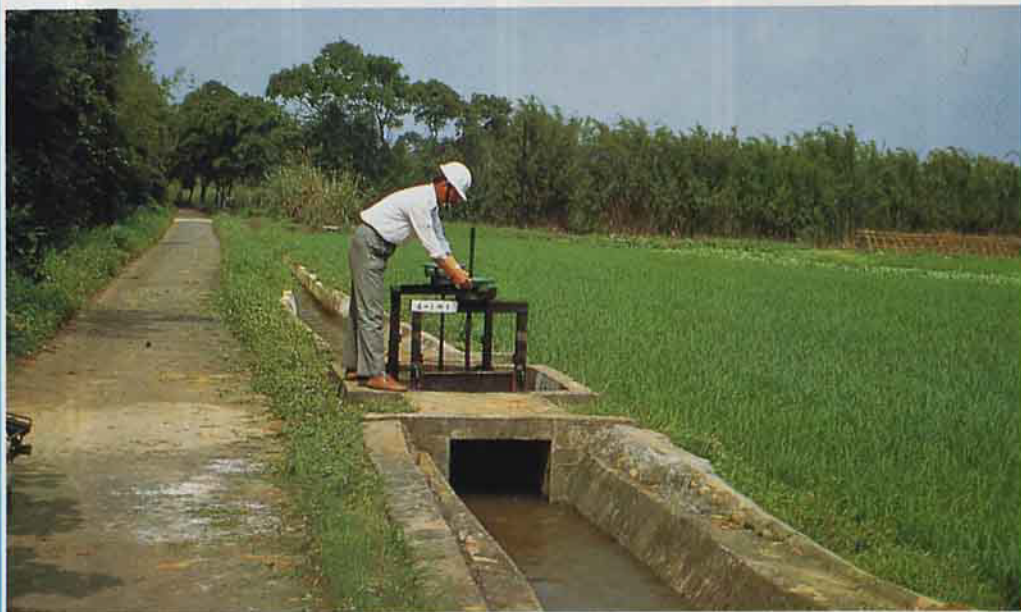
水稻灌溉

有關「農田水利會組織通則」修正案，目前正送立法院審議中，此一改進方案若能早日通過，付諸實行，可匡正水利會各項經營偏差，全面改善農田灌排服務品質。