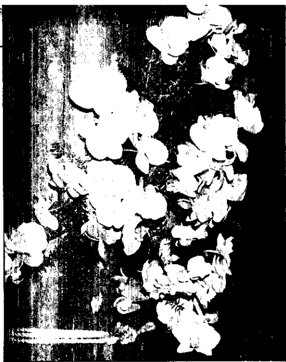
台東是蝴蝶蘭故鄉，而蝴蝶蘭也是台東縣花。