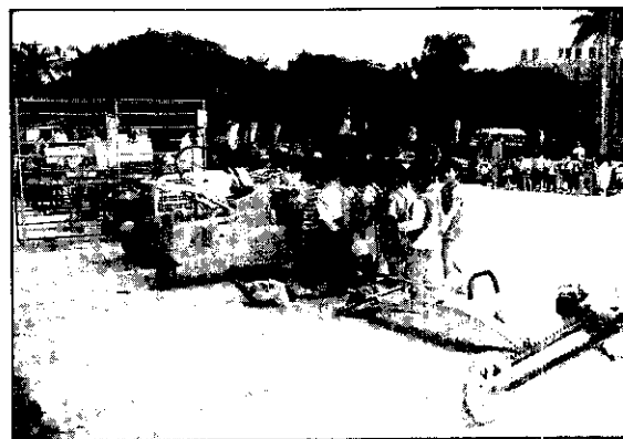
農機展的產品都是現時農民使用中的，許多小朋友看了既興奮又好玩。

所謂加進去的本土性項目有5點，分別是：1.因原住民九大族中，台東就有卑南、阿美、布農、排灣、魯凱、雅美六族，因此我們就善加利用山地文化資源，除有山地舞之外，還有山地文物雕刻展售和展示。