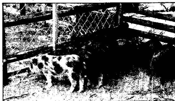
小耳種蘭嶼迷你豬