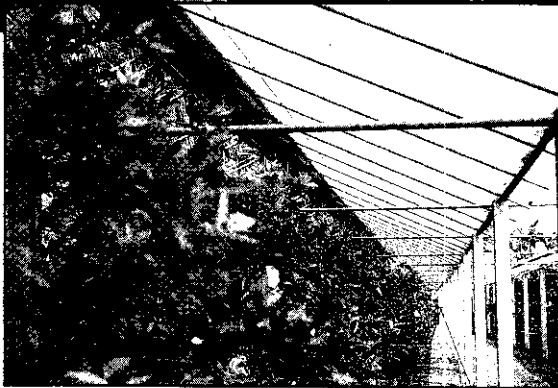
遮棚設施可防寒害