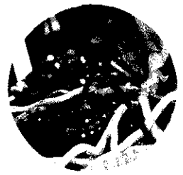
櫻花使用滴灌設備有調節花期及增產效果。