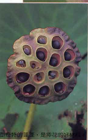
型奇特的蓮蓬，是插花的好材料。