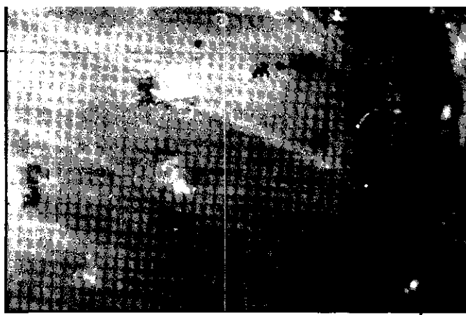
根蟎為害根部的情形 之成蟲。

③因多數老熟幼蟲皆於土中結繭化蛹，土壤耕耘時以粉耕方法碎殺其蛹，又灌溉時以噴灌方式替代，當可減少甜菜夜蛾下一代