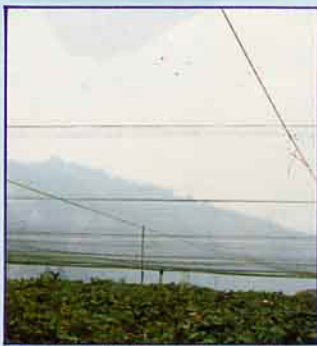
葡萄園使用防鳥網實景