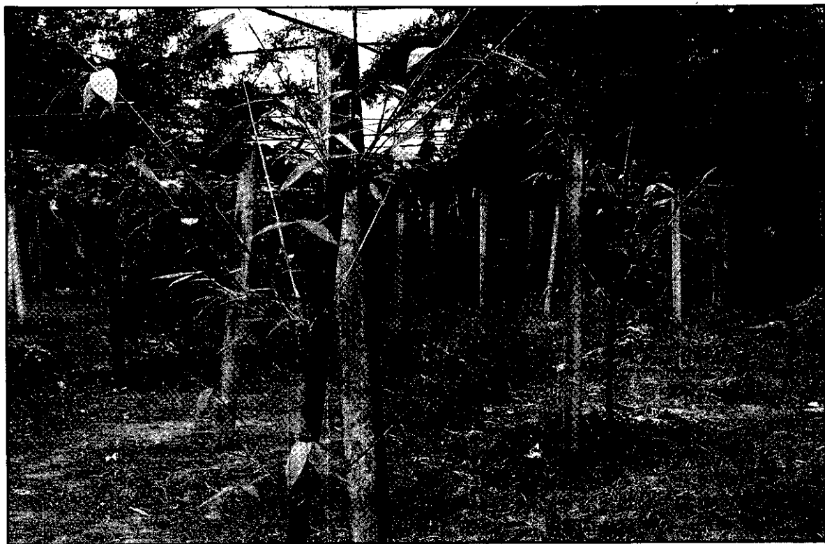
農友可向無病毒的竹園購買綠竹苗木