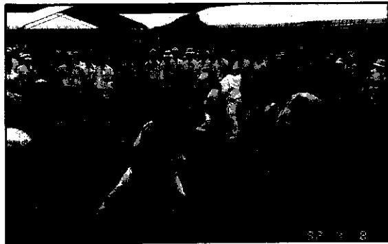
有百餘位農友表演的祥獅獻瑞