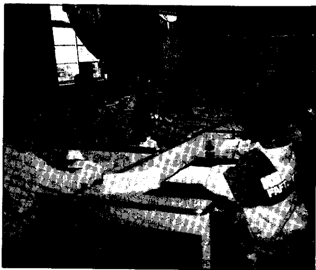
書法寫生比賽一角

特派兩部宣導車巡迴全鄉，張貼海報，宣導本活動辦理日期。兩部車分兩梯次進行，為都市回鄉子弟及各國校高年級學生作文