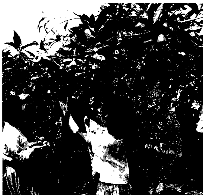
自行採摘，享受採果樂趣。