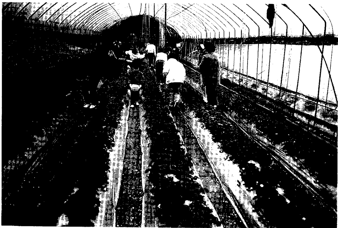
扶老携幼到果園採果，可增進家庭和樂氣氛。

觀光農園 (Tourism Agriculture) 為利用農業生產之場地、產品、設備、作業及成果等，提供遊客從事遊覽及觀察等活動，亦即農業生產和遊覽相結合之活動。其範圍包括農產、園藝、森林、漁業、畜牧等園區，使觀光遊客獲得遊憩玩樂、調劑身心、學習農業生產及體驗農產品收穫之樂趣等益處。