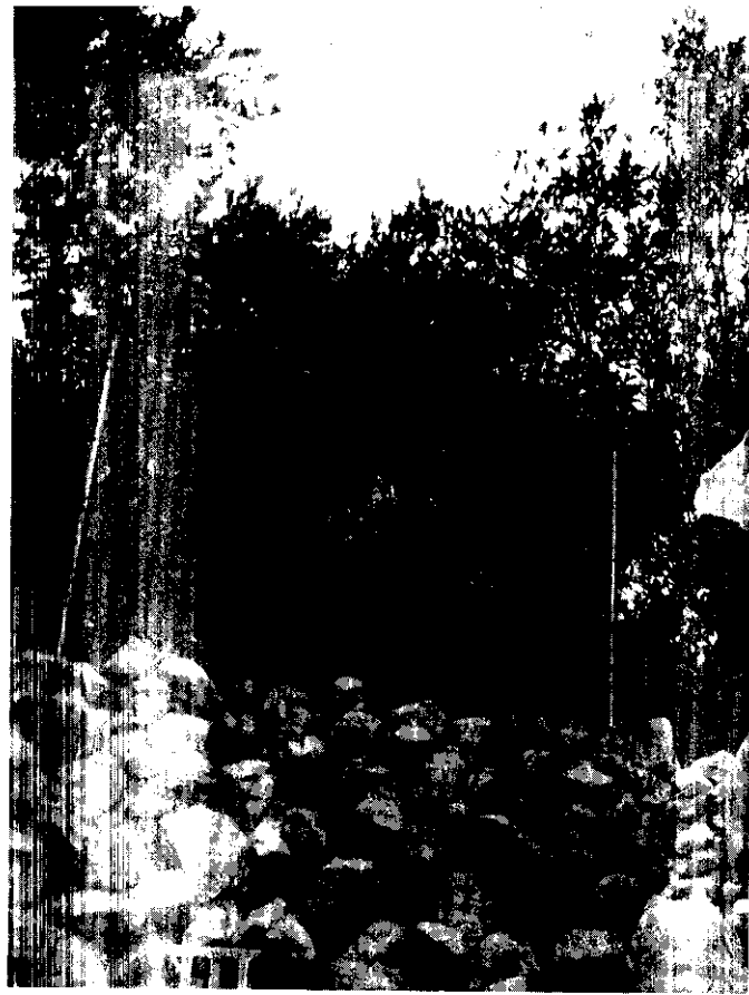
觀光農園時，人們舒展身心，增進聯誼機會。