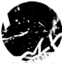
蘭花使用滴灌設備有調節花期及增艷效果。