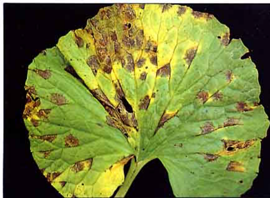
山葵黑心病葉部病徵