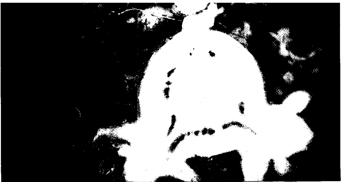
根莖橫切面黑心病病徵

力 (benlate) 可濕性粉劑1,000倍，亦應注意多雨期之防治，方可減少或抑制此病之蔓延。