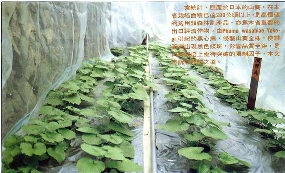
多兩期架設簡易塑膠布覆蓋措施，明顯減輕黑心病菌之為害程度。

據統計，原產於日本的山葵，在本省栽培面積已達200公頃以上，是高價值的食用類森林副產品，亦為本省重要的出口經濟作物。由 Phoma wasabiae Yokogi 引起的黑心病，侵襲山葵全株，使維管束出現黑色條斑，影響品質至鉅，是山葵栽培上亟待突破的限制因子，本文告訴您預防之道。