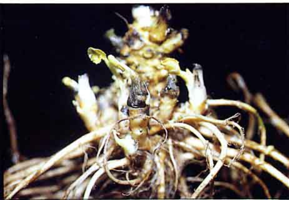
根莖上之分蘗芽嚴重罹患黑心病