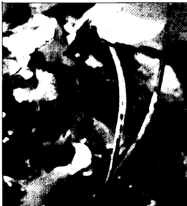
罹黑心病的山葵葉柄常呈黑色直線條斑之病徵

柄受病原菌隨雨水飛濺傳播之影響，常呈黑色直線條斑，若集中於葉柄與根莖連接處，病斑逐漸擴大後，嚴重者可侵入葉柄及根莖維管束，導致褐化、黑變，後期葉柄呈黑腐狀倒伏脫落，其上亦會產生柄子殼。根莖及鬚根被害時，表皮呈不規則黑色病斑，剖開內部，可見其維管束呈延伸性之黑化條斑（故謂之黑心病），可蔓延至分蘖芽及葉柄。花軸之病徵與葉柄類似，嚴重感染時可致種莢或種子亦受感染。