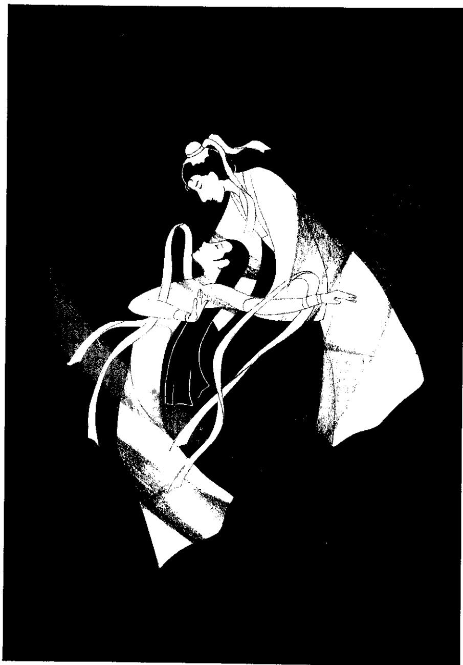
圖：歐陽莞婷 文：孫以蒼

相戀中的男女，喜歡稱對方為「心上人」。為什麼要叫做「心上人」呢？據說有下述的典故：