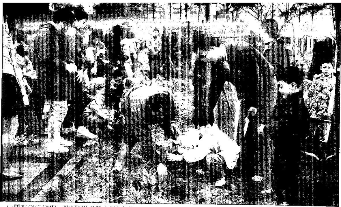
小朋友親身種樹，體驗「愛惜花木」的意義。

→ 們的活動，我都拒絕了」，我當時曾鼓勵他：「既是這樣，就要多多聯繫感情，很好啊！去參加吧！」可是我兒子回答說：「他們都會抽煙，而且他們的帶動，怎會比爸爸帶動的那麼好？」，另一次是我有一段時日忙於交際應酬，也參加過小四健會，有一天我內人拿了唸小學的兒子的日記給我看，其日記大體如下：「我有一位慈祥而且愛護我兄弟倆的好爸爸，平時假日他都主辦一些旅遊露營活動，使我們過得非常快樂，可惜我爸