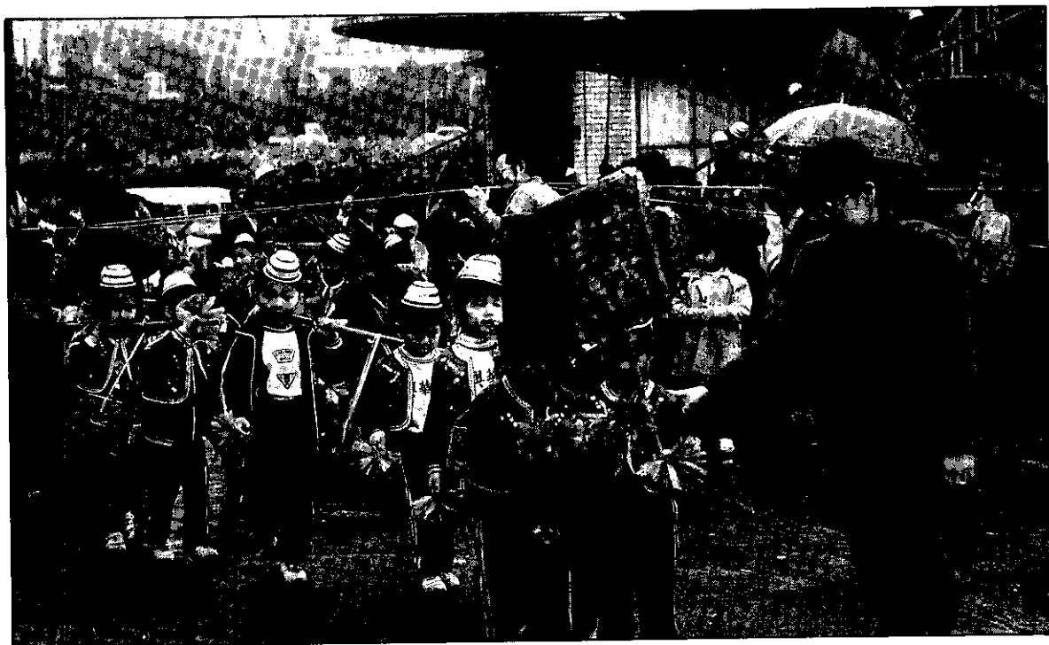
除了親子植樹活動，還增添兒童民俗才藝表演。

新竹林區管理處舉辦的親子植樹活動，將於3月7日8:00開始，在新竹漁港展開。除了繼續辦理前兩次的親子植樹活動外，更增加親子放風箏活動，同時，林管處將贈送5,000株杜鵑花等苗木，供民衆携回栽植。這次活動內容，已作成宣傳海報，與報名簡章、防火宣導、參與人員領取紀念品聯單、路標、植樹區域劃分標示牌、及各類宣傳手冊分贈有關人員及張貼，以加強植樹節宣導。