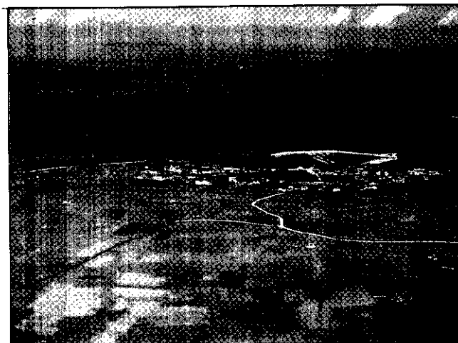
澎湖的季風強烈，造林種樹以耐風、耐旱爲主。