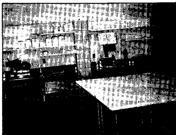
西湖鄉農會牛肉分切室內部設備

2.建立地區性特色產品，在觀光據點（地區）清境農場、墾丁國家公園及東海岸觀光線建立以省產牛肉為特色之產品，例如省畜試所恆春分所省產牛肉加工品展售館所展售之小包裝牛肉乾、麻辣牛肚等甚受觀光客之歡迎；又如台東縣肉牛生產合作社所推出之「貴妃」品牌牛肉製品除直銷北高兩市外，在東海岸觀光線亦是有口皆碑，無形中亦提高了省產牛肉的附加價值。