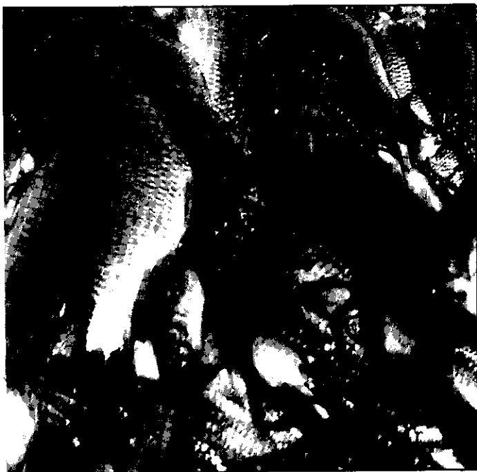
溪流魚類資源經保護後，魚多而肥大。

1. 加強擴大宣傳工作，印製「野生動物法，漁業法等保育法令」，護溪愛魚，大家一起來愛護野生動物等傳單海報，分發各機關學校、教會及每一家庭，並利用村民大會、教會集會及各種集會，適時機會教育宣導以擴大宣傳效果，達成鄉民對保育工作的共識。