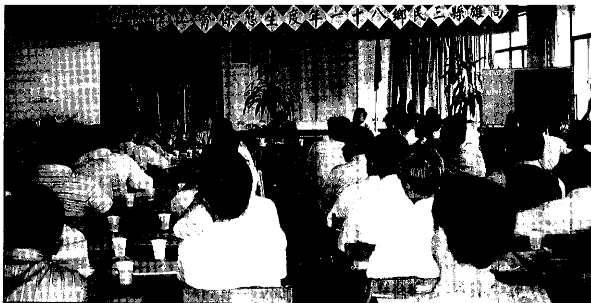
檢討過去，策勵未來。