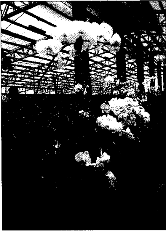
近年來我國外銷日本等國的蘭花，盛名遠播。

景植物的輸入，應事先取得該政府核發的輸入許可證，並於輸出植物檢疫證明書上加註該植物係栽植於未含Papillia japonica, Xiphinema americanum, Radopholus similis, Globodera rostochiensis, Globodera pallida等病虫害的地方，經查本省尚無上述病虫害發生記錄，同意於輸出植物檢疫證明書上加註未含所要求病虫害的