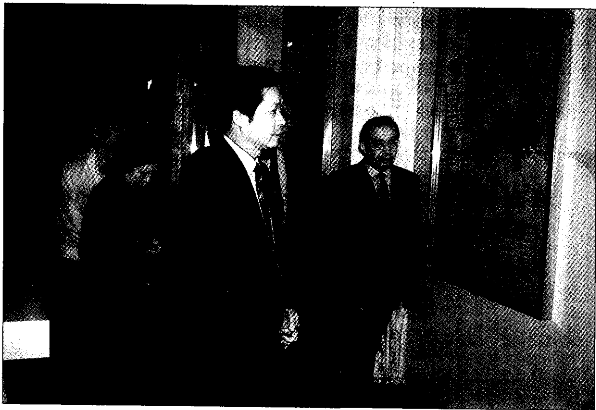
石校長夫婦參觀台南區農改場簡報室