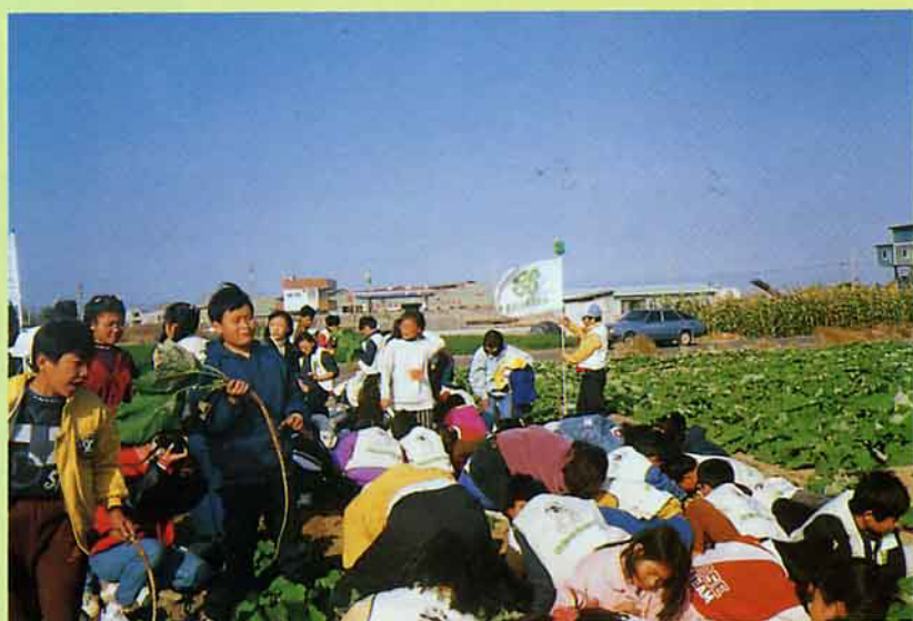
大家來拔牛蒡，看誰的牛蒡最長？