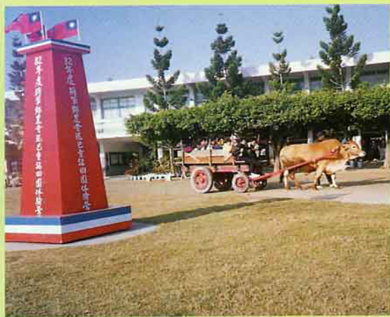
牛車之旅，新鮮有趣！