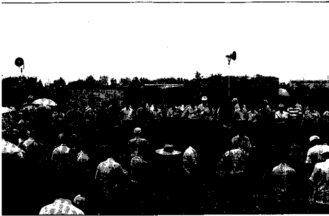
農委會孫主委主持81年學甲鎮田菁綠肥示範觀摩會

20~30cm。種子多數，長橢圓形，黑褐色，地上發芽型，初生葉單葉、羽狀複葉、互生。為本省最重要一種綠肥作物，並可當牧草，泰國人吃食嫩葉。