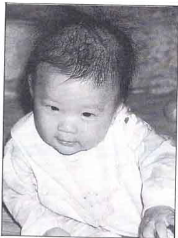
流行性角膜炎通常是兩側性發炎，抵抗力較差的兒童常會伴隨腸胃疾病或發燒。

引起流行性角膜炎的病毒種類非常多，其中以腺病毒最為常見。夏天病毒繁衍快速，幾乎無所不在，如果不能時時保持手部清潔，很