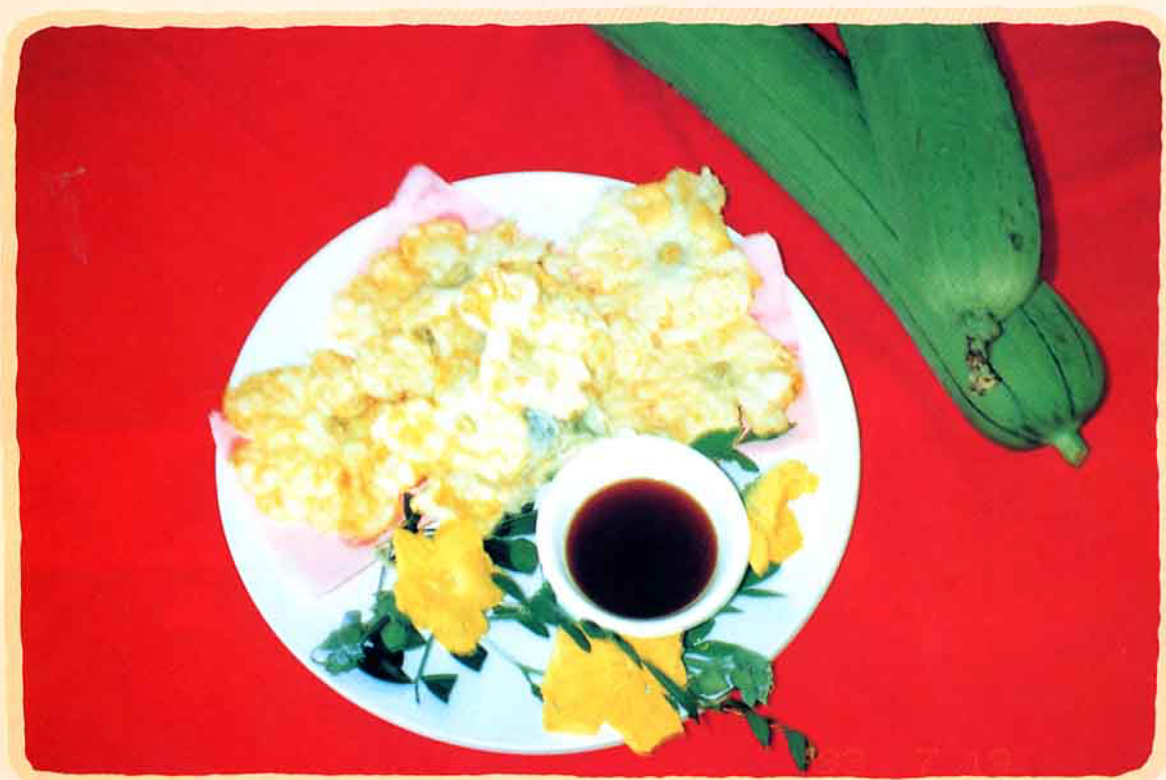
礁溪鄉農會推廣的溫泉鄉絲瓜花做佳餚

絲瓜的花是黃色的，花瓣很薄，艷陽高照時，在綠色的瓜棚上，開滿了黃色的花朵，煞是漂亮，引來蜜蜂飛舞，傳佈花粉，然後結出一條條翠綠可愛的絲瓜來；而欲取絲瓜花做菜，則必須利用雄性花朵迎著陽光開