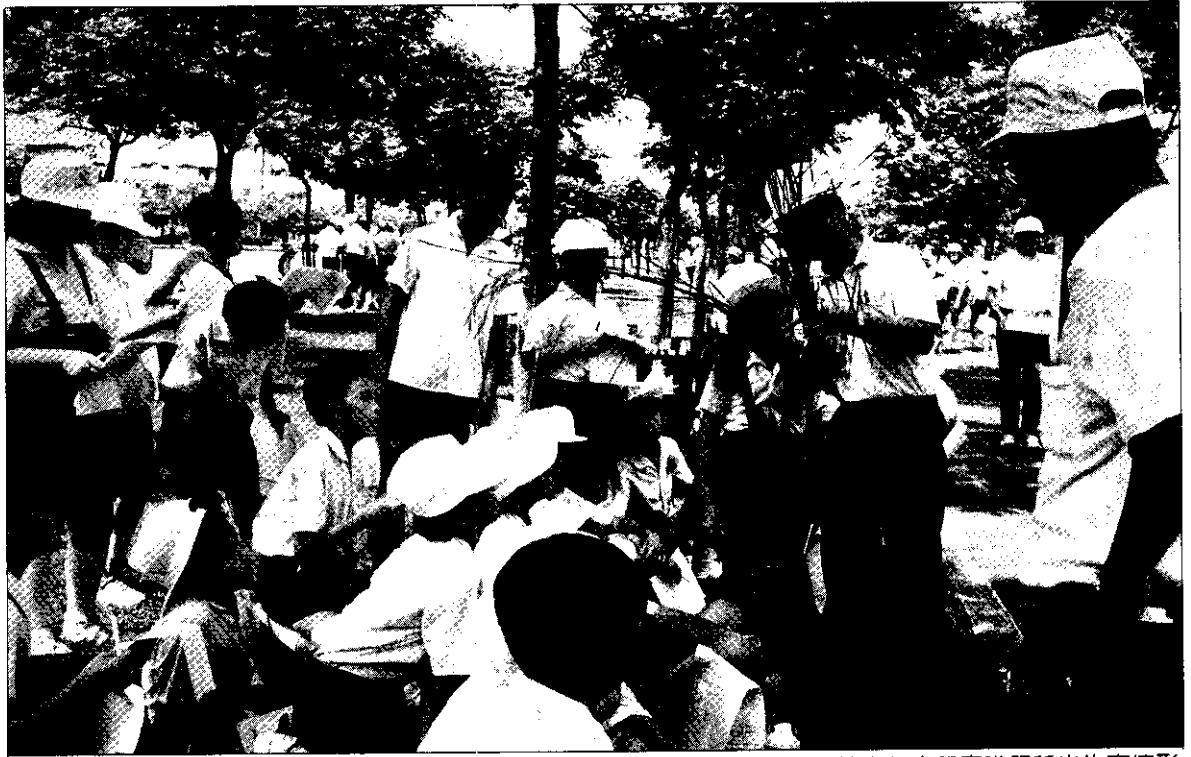
各校老師向學童講解稻米生育情形

處)人員帶領學童前往農村,親自體驗耕耘之辛勞與樂趣,使學童了解”“一分耕耘、一分收穫”,進而了解“盤中食粒皆辛苦”的意義。第二階段為“結穗期”,於5月份舉辦,聘請農業改良場技術人員現場講解