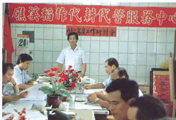
工作人員常利用夜間不定期舉辦研討情形

近年來由於本省工商業急速發展，農村勞力嚴重外流，造成農村勞力不足與老化現象，加上個別農場面積狹小，以致生產成本增高而收益減少，農民務農意願逐年降低。宜蘭縣礁溪鄉水田面積2,190公頃，大部分為兩期作水稻田，礁溪鄉農會於民國78年起積極輔導設置稻作代耕代營隊，至80年為止，經中央核准補助設立8隊，同時為使農機使用發揮最高效率，於79年12月1日成立稻作代耕代營服務中心，透過組織運作，按規畫之作業區段順序實施委託代耕及委託經