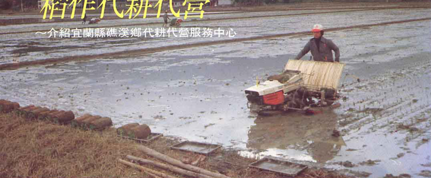
服務中心的班員在田間耕作