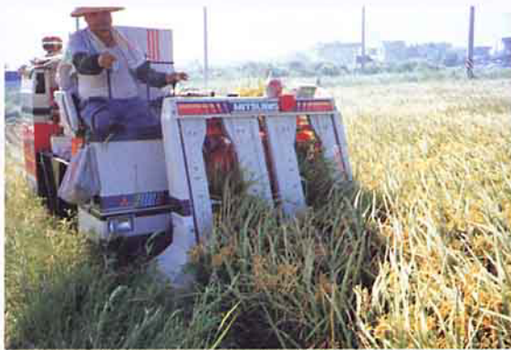
服務中心成員共有43個基本班員，可作整地、插秧、收穫、乾燥等工作。

近年來由於本省工商業急速發展，農村勞力嚴重外流，造成農村勞力不足與老化現象，加上個別農場面積狹小，以致生產成本增高而收益減少，農民務農意願逐年降低。宜蘭縣礁溪鄉水田面積2,190公頃，大部分為兩期作水稻田，礁溪鄉農會於民國78年起積極輔導設置稻作代耕代營隊，至80年為止，經中央核准補助設立8隊，同時為使農機使用發揮最高效率，於79年12月1日成立稻作代耕代營服務中心，透過組織運作，按規畫之作業區段順序實施委託代耕及委託經