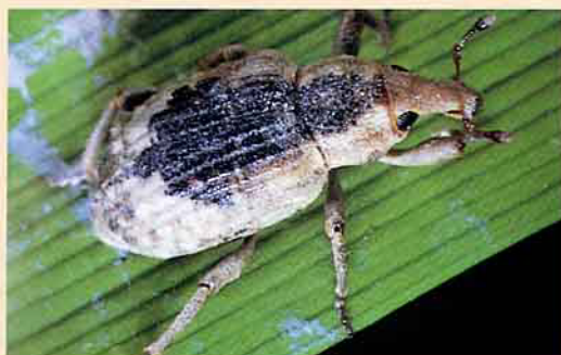
水稻水象鼻蟲成蟲 (為害水稻葉片)