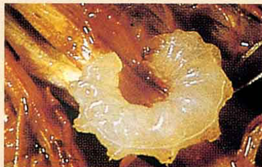
水稻水象鼻蟲幼蟲 (為害水稻根部)