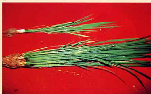
(上) 水稻被害狀 (對照) (下) 施用好年冬3%粒劑