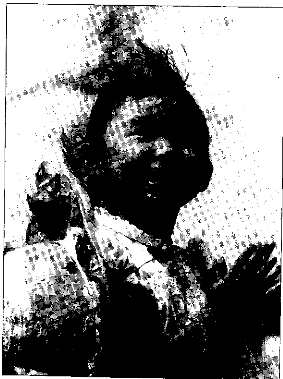
夫妻双方若有生育之計劃，應事先到醫院做健康檢查，以培育出健康的下一代。

因此我開始緊張不妥，在公婆的引領下展開求神問卜的歷程，跑遍北中南大小廟宇，不知吃了多少香灰符水，小明的病情仍無進展起色，雖在二水鄰近醫院診所看病，仍不知是何病。直至在朋友介紹下，至榮總接受檢查後，醫生以沉重的口吻說：「您的孩