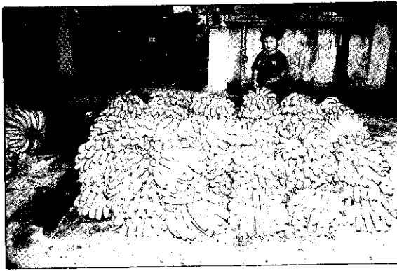
一堆堆香蕉是農民的心血

12.5公斤) 的到岸價格 (CIF) 只有9.8美元，所以產地的製作價根本就拉抬不到12元，以竹田鄉今年和青果合作社製作的32公頃香蕉而言，從2月到6月其收購價就從12元一路降到10元左右。