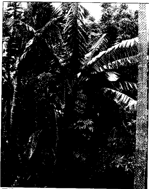
要將一串串飽滿的香蕉摘下扛出香蕉園，可得耗去工作人員相當的體力。

以他個人的看法，台灣的蕉農要有利潤，產地價最起碼也應在每公斤15到16元左右，可是目前的情況，台灣外銷日本每箱（