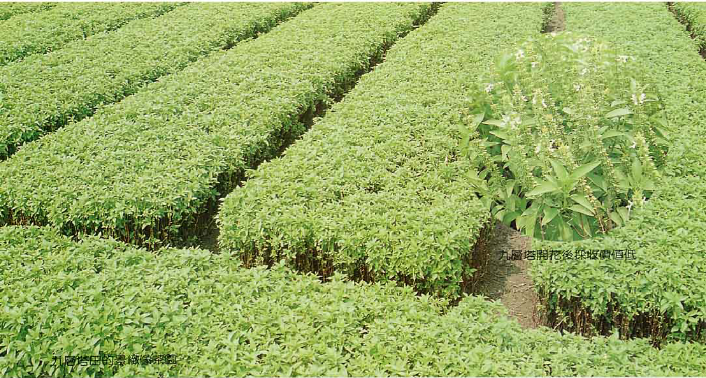
九層塔田的景緻像茶園