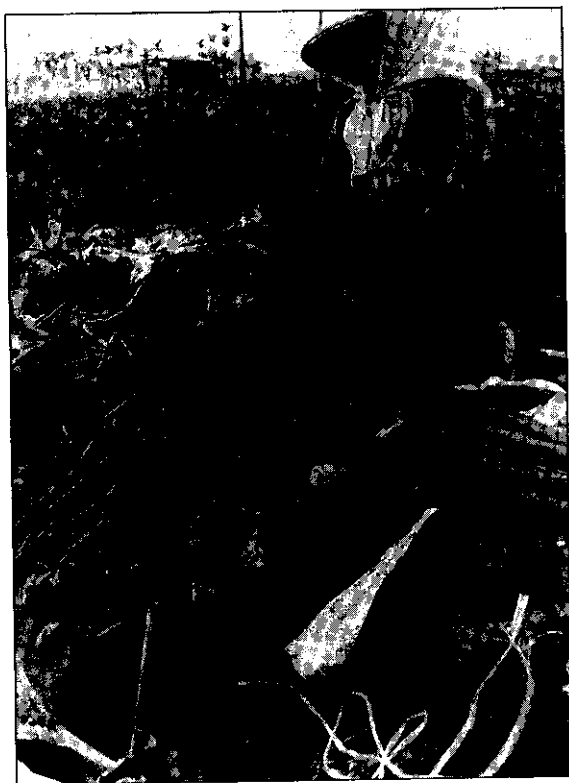
去除泥土好運銷的牛蒡

台灣的新興蔬菜，答案是：錯了。其實，牛蒡在屏東市落籍已有20~30年了，只是面積一向不多，又大部份外銷日本，所以知名度一直沒有打開。直到最近2、3年，由於台南地區大量栽培，使得牛蒡一夜之間成爲家喻戶曉的作物。