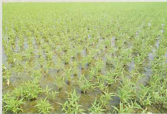
空心菜採種田栽培方式似水稻田 空心菜留種