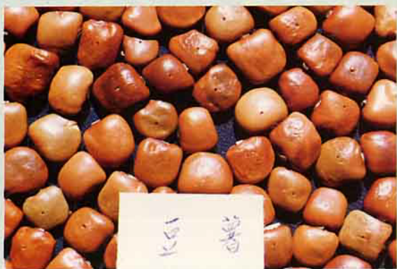
豆薯播種前種子需先打洞 屏東市蔬菜小包裝