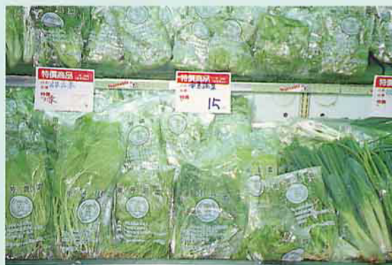
台南市網室栽培的蔬菜，大部分為葉菜類。